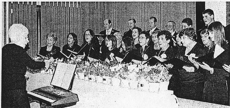
VOCI Il coro "Novum Canticum" all'inaugurazione ufficiale