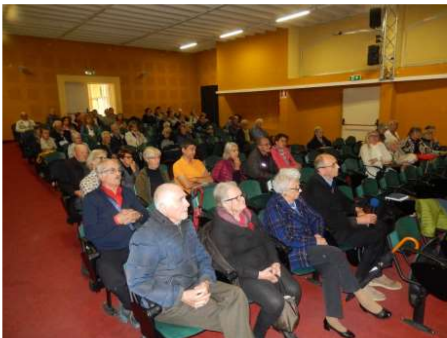
Auditorium Trombini - Tirano, 16 maggio 2023

La Dottoressa risponderà anche alle domande dei partecipanti.