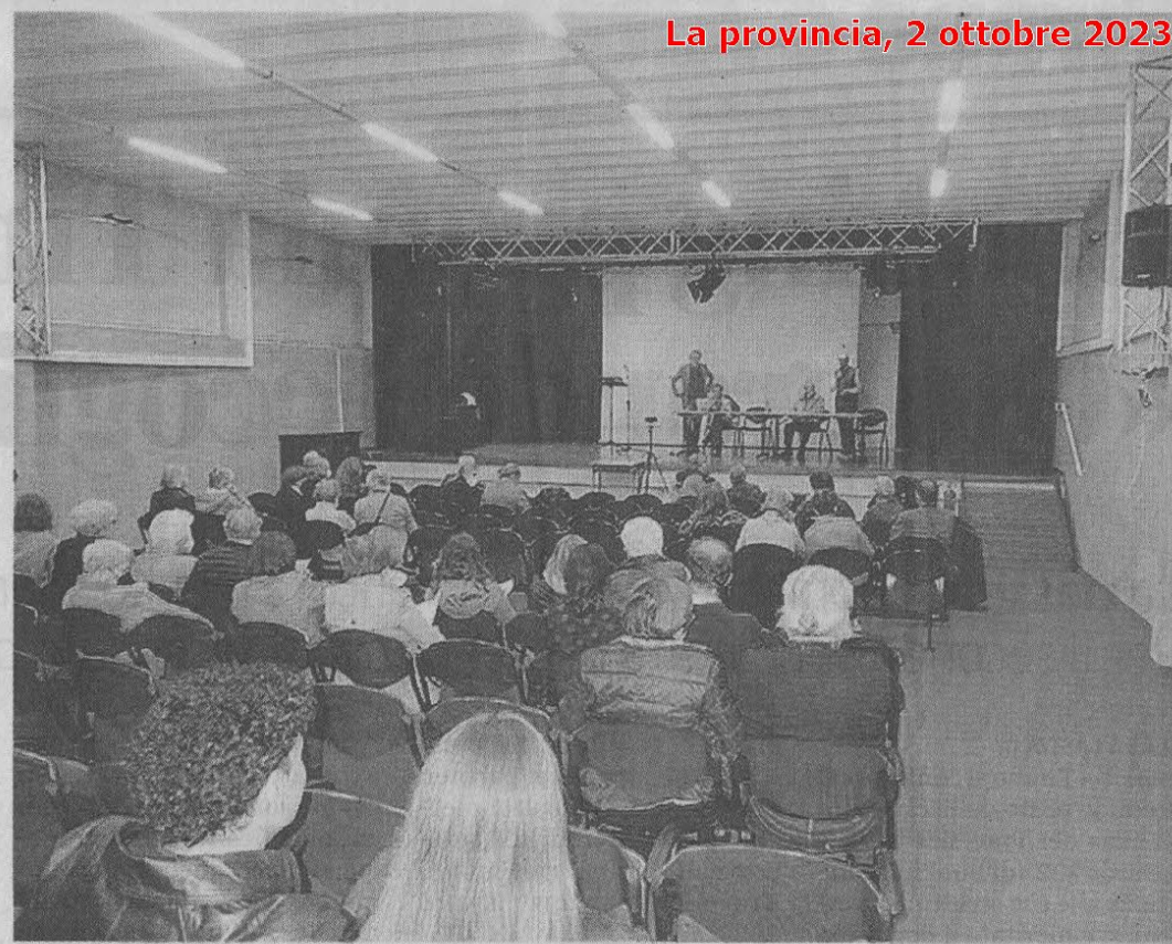
Uno degli incontri all'Unitre di Tirano dello scorso anno