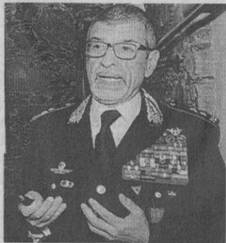
Il generale Carmelo Burgio

Martedì 31 ottobre, la lezione settimanale dell'Unitre Tirano sarà aperta al pubblico (non solo ai soci) e sarà tenuta dal generale dei carabinieri Carmelo Burgio sul tema Afghanistan, vissuto sul campo. Il