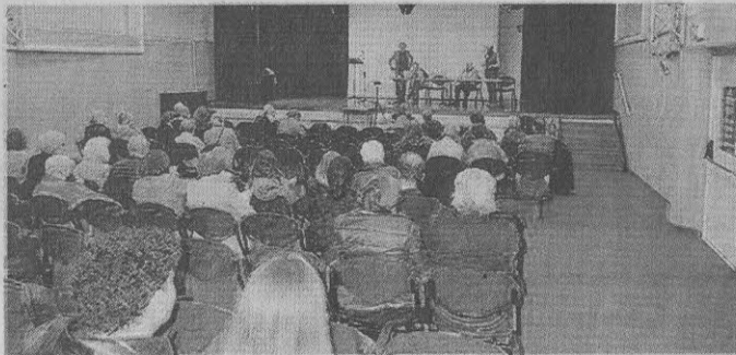
Una conferenza dell'Unitre dell'anno scorso